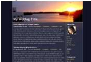
Exemple de modèle de présentation